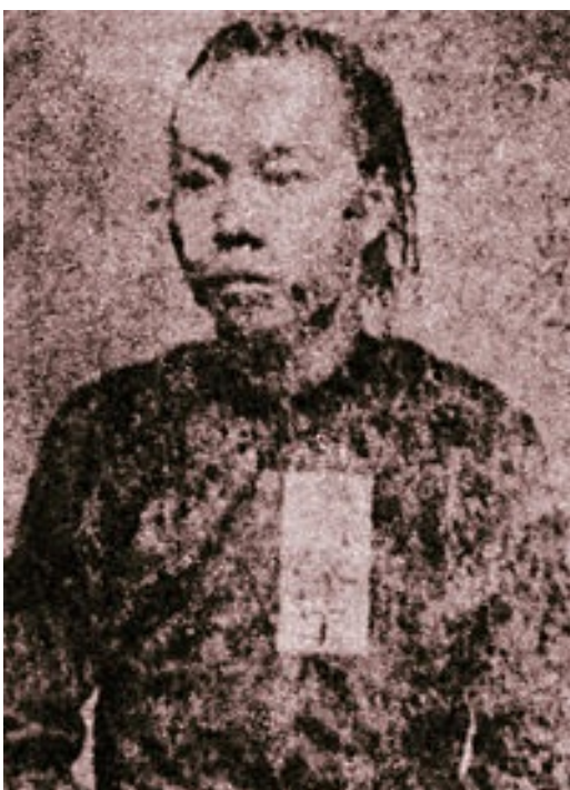
廖添丁生於，清帝國臺灣道臺灣府大肚上堡秀水庄